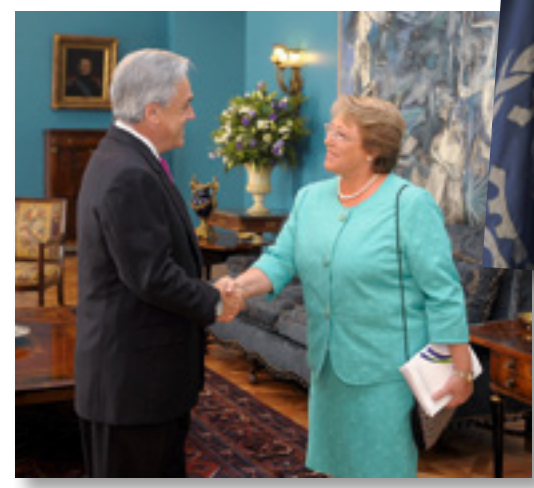
2012 Das Engagement geht weiter: Bachelet zu Besuch bei ihrem Nachfolger Sebastián Piñera (links) und als Direktorin von UN Women (oben)

Vereinfacht gesagt. Doch man soll diese Bedürfnisse nicht gegeneinander ausspielen. Natürlich braucht es Gesundheit und Vergnügen. Bildung und Fussballplätze. Aber es ist schon so: Frauen setzen andere Prioritäten. Nicht nur in Entwicklungsländern. Es reicht ein Blick in ein beliebiges europäisches Gemeindepapament, um festzustellen, dass sich Frauen generell mehr für Bildung, das Gemeinwesen und die Gesundheit engagieren als Männer. Speziell in Ländern mit hohen Sterblichkeitsraten ist das überlebenswichtig.