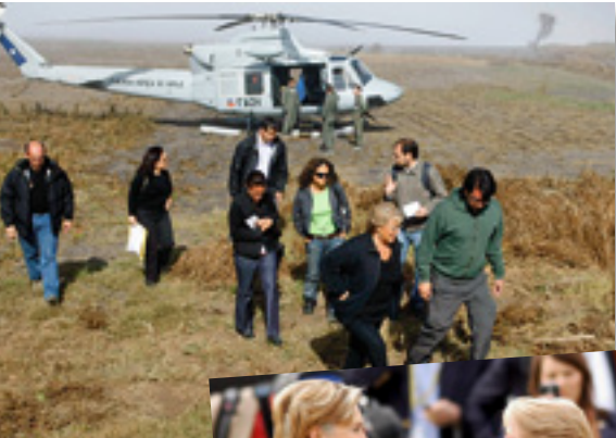
2010 Erdbebenkatastrophe in Chile: Präsidentin Bachelet mit Journalisten (oben) und Hillary Clinton