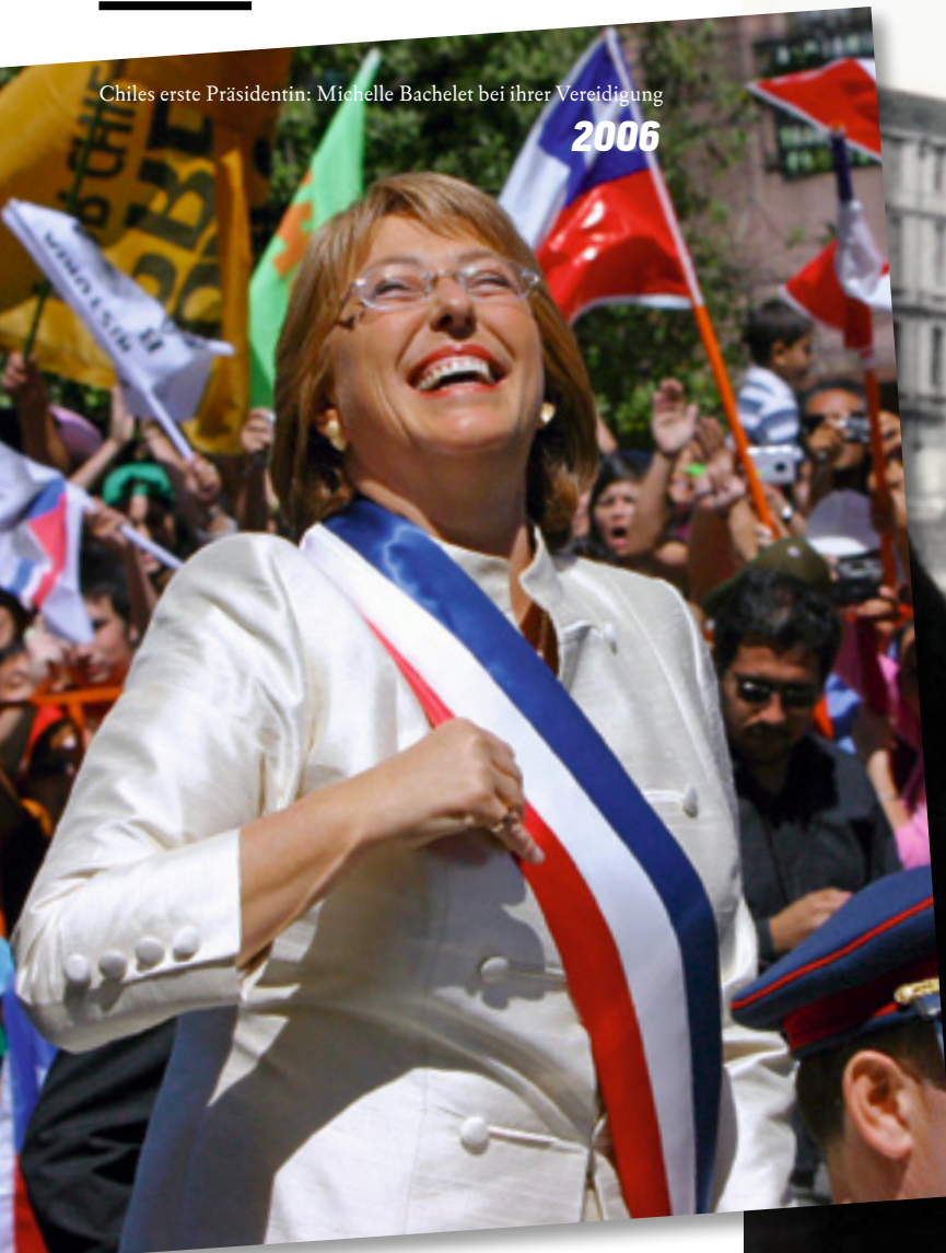
Chiles erste Präsidentin: Michelle Bachelet bei ihrer Vereidigung